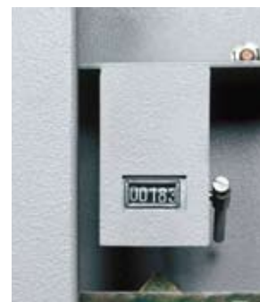
Le compteur et le scellé du foncet (en option): de précieux indices pour savoir si l'armoire a été ouverte en votre absence.