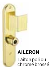
AILERON Laiton poli ou chromé brossé