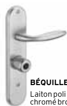
BÉQUILLE Laiton poli ou chromé brossé