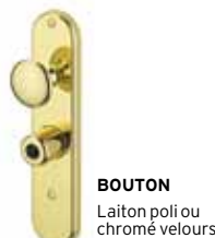
BOUTON Laiton poli ou chromé velours